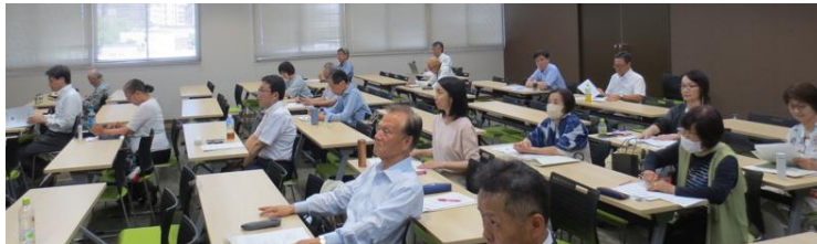
【講演を聴く参加者風景】

現在の状況を鑑み、「NPO法人としての限界」「団体会員を増やす必要性」「啓発活動の必要性」などを交え、「今の延長線上での活動では“特定”認定は無理だ」と指摘され、会員・団体の連携及び開設当時発揮した粘り強い行動と信念をみんなで思い起こしながら奮闘していくことを訴えられました。