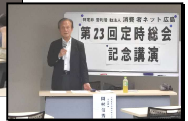
【第 23 回定時総会の様子】