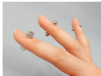
指を挟んでも付く程の強い磁力を持つマグネットボール

マグネットボール、キューブを誤飲すると生死に関わることがあります。少しでも誤飲が疑われる場合には、すぐに医療機関を受診してください。